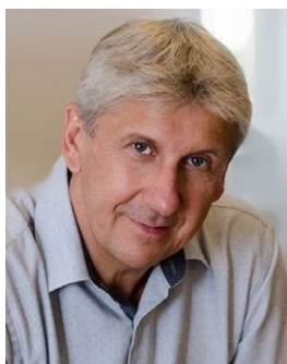
Jiří Miler starosta

zvolené zastupitelé města na ustavujícím zasedání dne 5. 11. 2018